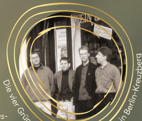
Die vier Gründer vor der 1. VINOS-Filiale in Berlin-Kreuzberg

Wolf: Absolut – da waren wir echte Vorreiter! Und egal, wie sich alles entwickelt: Wein bleibt ein Kulturgut. Auch in 30 Jahren werden die Menschen Spaß am Genießen haben – und an spanischem Wein sowieso.